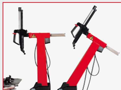
Versione A 224A - A 224A version - Versionen A 224A

PNEUMATISCH KIPPBARE MONTAGESÄULE mit erhöhter Torsionssteifigkeit in allen Arbeitspositionen